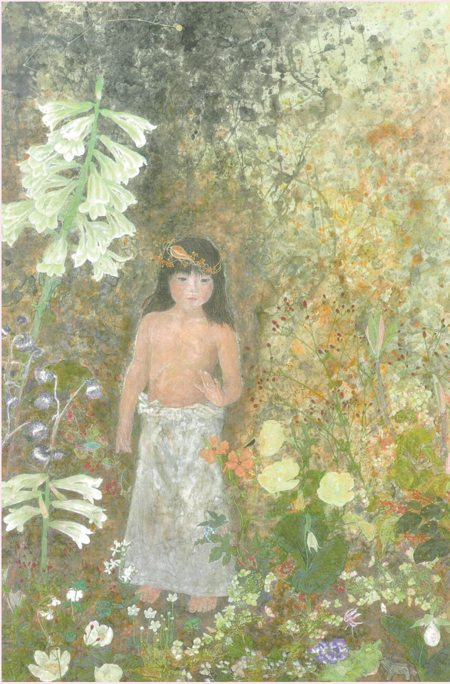
東北の地よ IV (ヘクソカズラの冠) 2021年 第8回日展