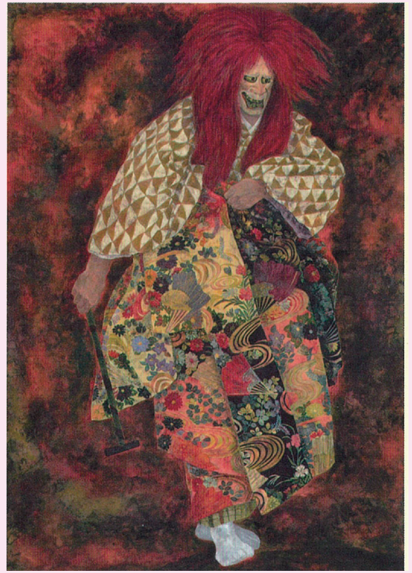
鐘巻(黒川能) 2012年 第44回日展 2012年度日本芸術院賞

1944年東京浅草生まれ。1962年多摩美術大学絵画科(日本画)に入学。奥田元宋に師事。1963年第6回日展に《卓上》で初入選。1972年、第4回日展(改組)で《生きる》が特選となる。1973年第2回宮城県芸術選奨を受賞。1975年日展で《日食》が特選となる。1980年第12回日展で審査員を務める。1981年日展会員となる。1982年第14回日展で《黒川能》が日展会員賞。1994年日展評議員となる。2009年第41回日展で「敦盛(黒川能)」が文部科学大臣賞。2012年第48回神奈川県美術展で審査員を務める。2013年《鐘巻(黒川能)》で2012年度日本芸術院賞を受賞。2014年第63回河北文化賞を受賞。2024年第85回河北美術展で審査員を務める。「能島和明 日本画展 東北の地よ(カメイ美術館)」。県展審査員多数。現在日展特別会員・元理事、日春展・会員、宮城芸術協会・名誉会員、河北美術展・顧問。