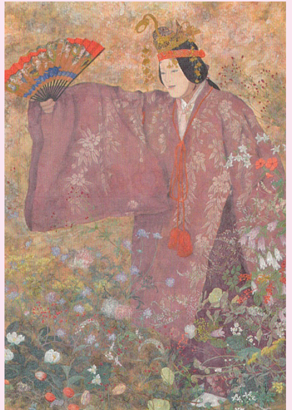
東北の地よ V (賽の花野に) 2022年 第9回日展 ※今回の展覧会での展示はございません。